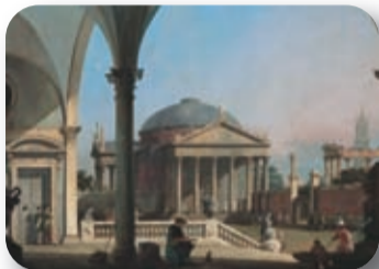
Antonio Canal detto Canaletto Capriccio architettonico 1755