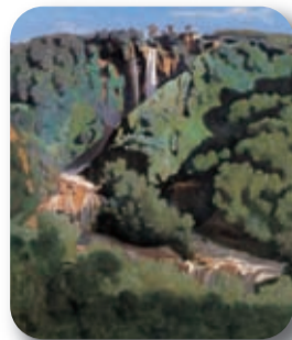
Jean-Baptiste Camille Corot La Cascata delle Marmore 1826