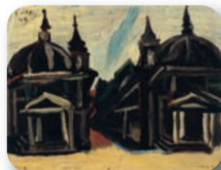
Renato Guttuso Piazza del Popolo Collezione Cinquanta Pittori per Roma