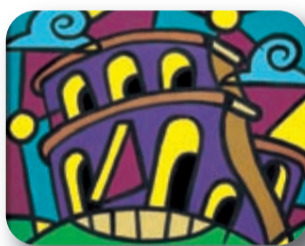
Pablo Echaurren Colosseo Collezione Cinquanta Pittori per Roma 2000