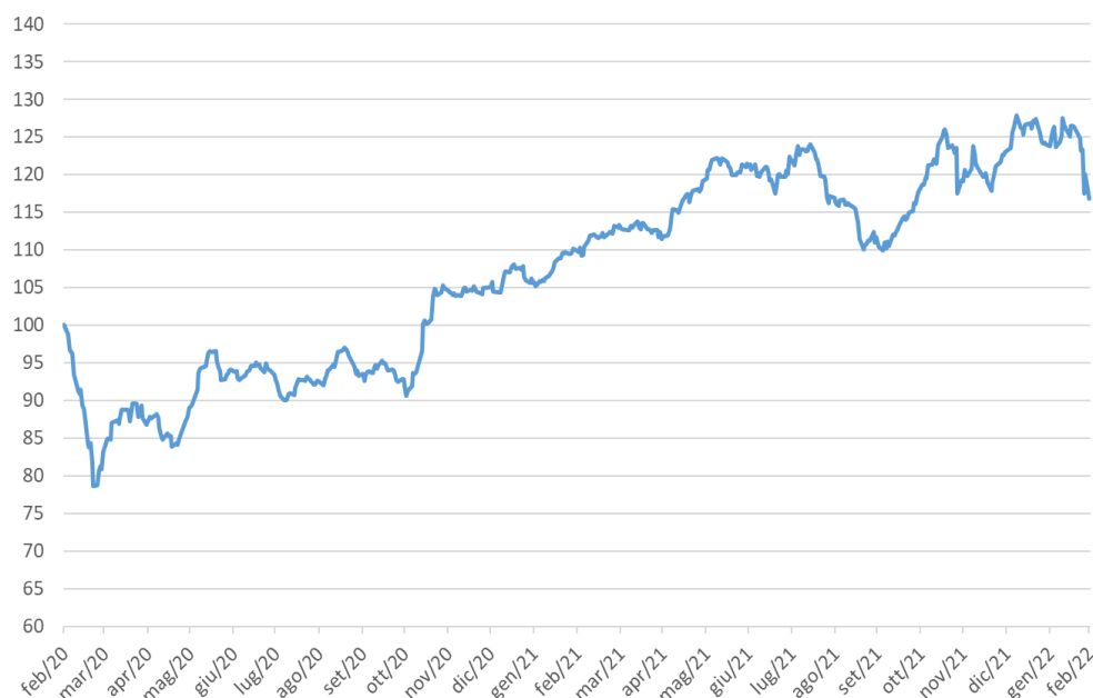
Performance Paniere Equipesato negli ultimi 2 anni (dal 28/02/2020 al 28/02/2022)