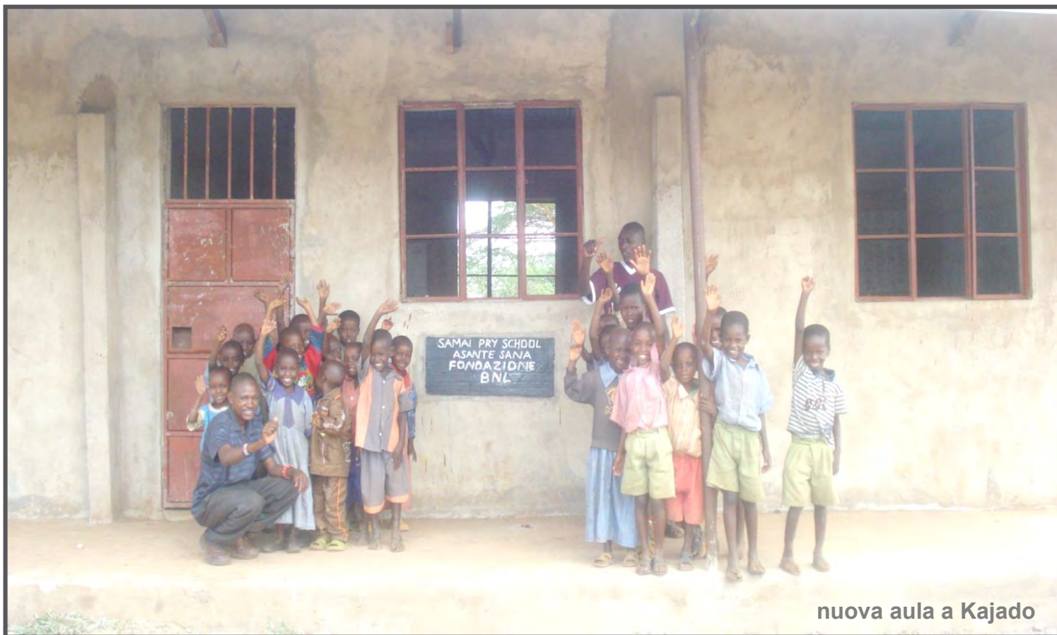
nuova aula a Kajado