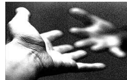
HELP 2 HELP XI° Edizione

Una componente molto forte è rappresentata dagli interventi a favore dei Paesi più poveri , in particolare di Africa ed Asia , dove anche piccole somme come quelle concesse singolarmente dal progetto arrivano poi a realizzare importanti risultati. In termini di finalità, quasi il 50% dei progetti sono stati dedicati a combattere l’ emarginazione e la disabilità , il 21% in favore della sanità e oltre il 14% indirizzati al tema dell’ infanzia .